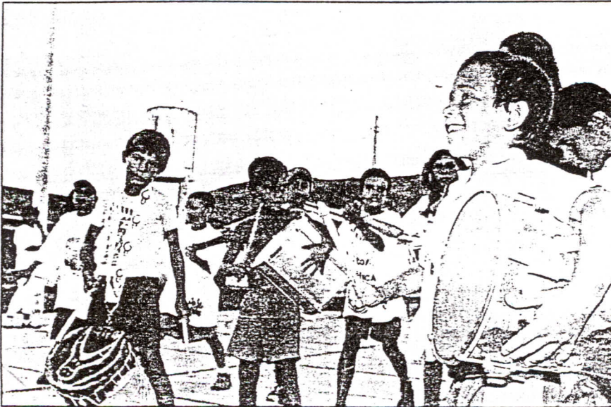
Crianças estão inseridas no projeto "Alevanta, boi não caí". Objetivo é manter viva a tradição do Boi-de-Mamão

Florianópolis e que preten-tem levar a tradição do Boi-de-Mamão para os colégios da rede municipal -, as 35 crianças e adolescentes trabalham aspectos de